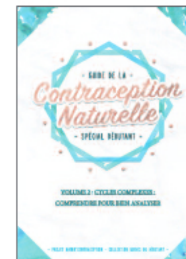
Volume 2 : Cycles complexes : comprendre pour bien analyser