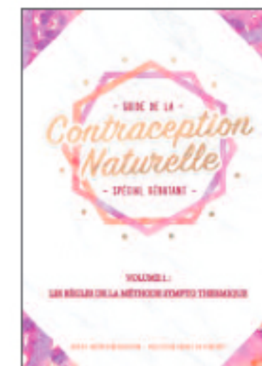
Volume 1 : Les règles de la Méthode Sympto Thermique

Guides disponibles sur commande : Site Natur'Contraception : https://contraceptionnatur.wixsite.com/rennes